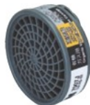
7007J (コンピネーション吸気缶)