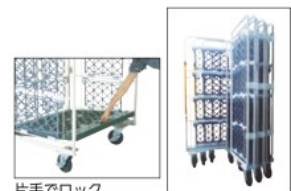
片手でロック ハンドル解除