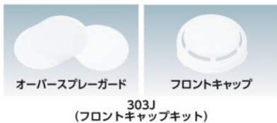
オーバerspレーガード