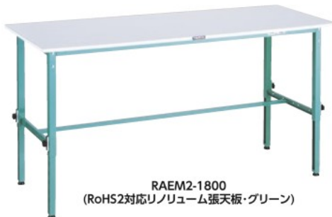
RAEM2-1800 (RoHS2対応リノリウム張天板・グリーン)