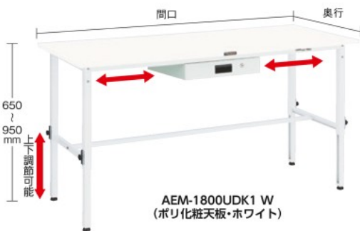
AEM-1800UDK1 W (ポリ化粧天板・ホワイト)