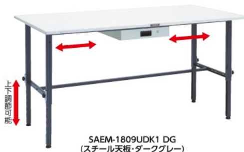
SAEM-1809UDK1 DG (スチール天板・ダークグレー)