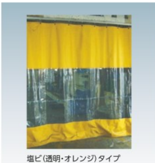
塩ビ(透明・オレンジ)タイプ