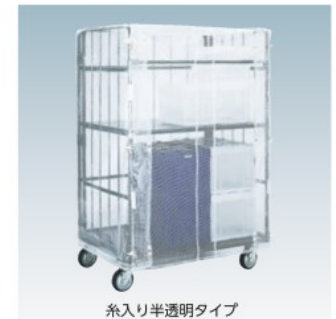
糸入り半透明タイプ