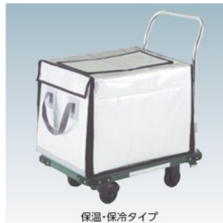
保温・保冷タイプ