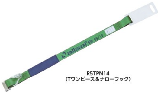
R5TPN14 (Tワンピース&ナローフック)