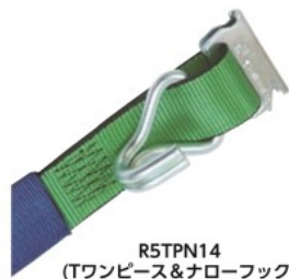
R5TPN14 (Tワンピース&ナローフック)