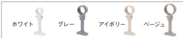
品番コード A10467 PP立バンドセット品 (SGP用) ホワイト 単位 (mm)