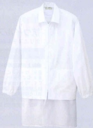
HH 4317-001 ホワイト