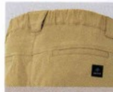
シャーリングウエスト