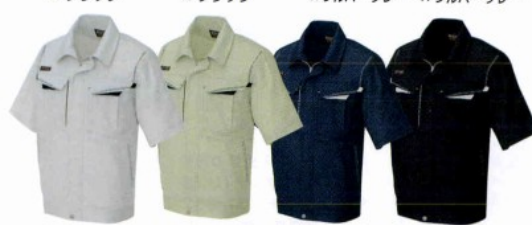
003 シルバーグレー×ブラック 005 アースグリーン×ブラック 188 フォレストネイビー×シルバーグレー 010 ブラック×シルバーグレー