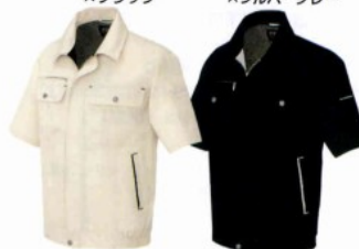
010 ブラック×シルバーグレー