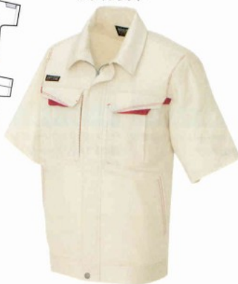
002 ベージュ×ワインレッド