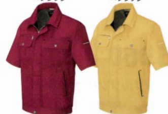
002 ベージュ×ブラック