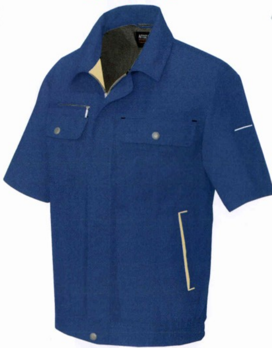
006 ロイヤルブルー×イエロー