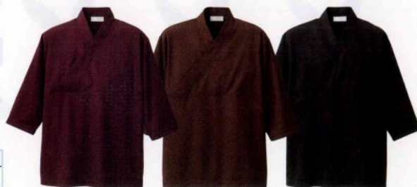
HS 2900-013 ワイン HS 2900-025 ブラウン HS 2900-010 ブラック