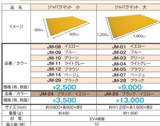
ブラック/イエロー