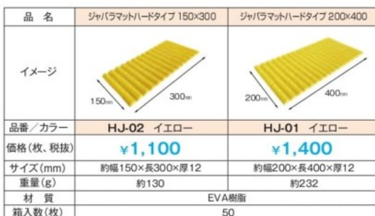
荷締めの緩衝材に