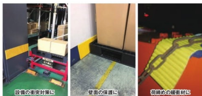
設備の衝突対策に