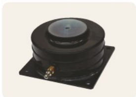
▲ ニューマクッション