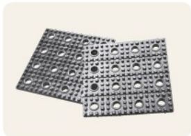
▲ TT-DR 防振パット