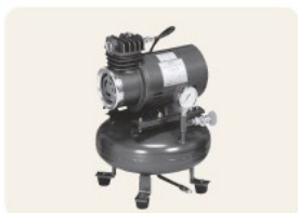
▲ CVS-200-R コンプレッサ