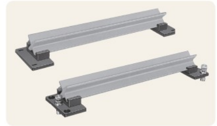
▲ C-212-(1)/(2) X型レールスタンド