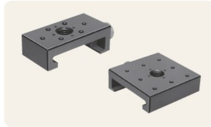
▲ C-211-(1)P/(2)P X型レールキャリア