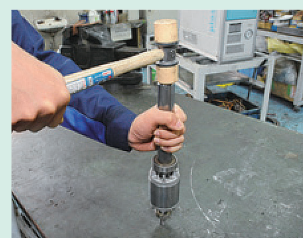
ベアリング挿入治具