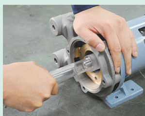
メカニカルシール押え