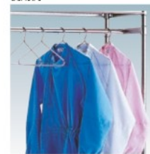
株式会社キャニオン [345555]