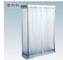
カーテンを閉じた状態 株式会社キャニオン [345555]