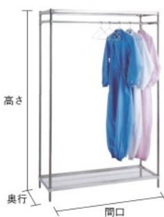
SHR-2662 (保護服・ハンガー別売)