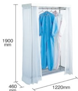
SHR-2562K (保護服・ハンガー別売)