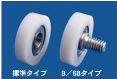
標準タイプ B/6Bタイプ

精密ベアリングを内蔵した樹脂成形製品です。 標準タイプとボルト付タイプを用意しています。