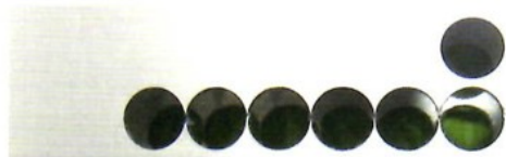
アルミ6063(二重板同時穿孔)

<推奨切削条件> 切削速度 V=50~100m/min 回転あたり送り f=0.041mm/rev ※切削条件が異なる場合は良好な結果が得られない場合があります。