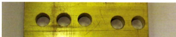
真鍮(ノンコートドライ穿孔)