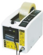
M-1000 (標準タイプ・テープ別売)