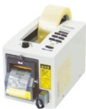
MS-2200 (安全機構+長さメモリー付・テープ別売)