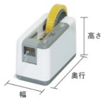
M-800 (簡易作業タイプ・テープ別売)