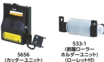
S656 (カッターユニット)