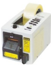
MS-1100 (安全機構付・テープ別売)