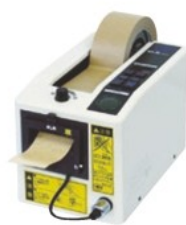
M-2000 (長さメモリー3種付・テープ別売)