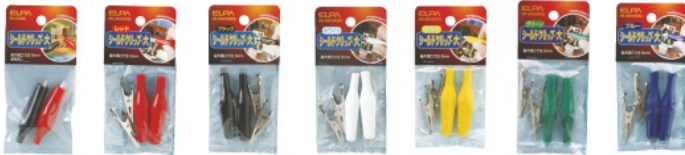
PU-23NH HK-SK03H(R) HK-SK03H(BK) HK-SK03H(W) HK-SK03H(Y) HK-SK03H(G) HK-SK03H(BL)