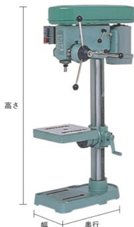
BT135-200V (角テーブル) (ドリルチャック別売)

特長 ●タップ折損防止機構を採用しています。 ●フローティング機構(ネジ山をつがさないようにする)を採用しています。 ●電子制御回路を採用しています。