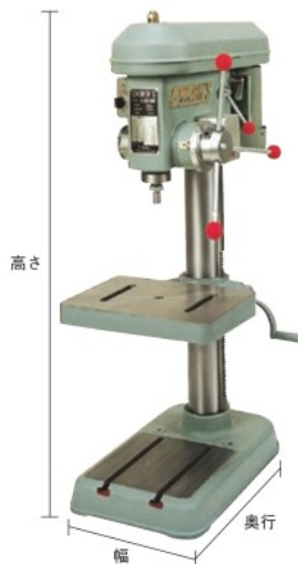
ESD-350NT-GK (角テーブル) (ドリルチャック別売)

特長 ●便利なねじ立て機構付ボール盤です。 ●タップ折損防止装置付です。 仕様 ●一台から異電圧に別作対応