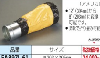
品番 EA897L-61 税抜価格 24,000円