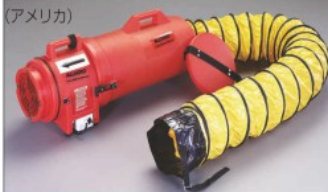
品番 EA897LD-15 税抜価格 98,000円