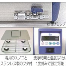
専用のスノコと洗浄時間と温度は1分、ステンレス製のフタ付 1度刻みで設定可能