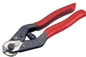
ワイヤロープカッター