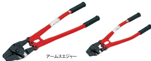
アームスエジャー