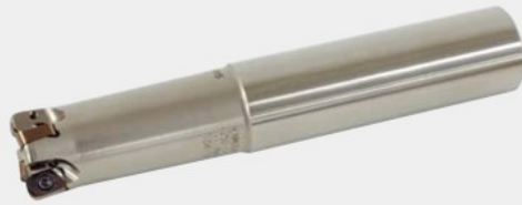
Fig.1 (一般形) (Standard type)

○は数字、□は英文字が入ります。 Numeric figure in a circle ○ and Alphabetical character comes in a square □.