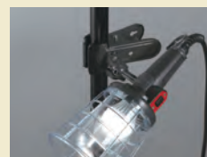
クリップで固定照明にも できます