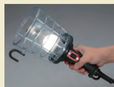
軽量で落としても丈夫な タフボディ