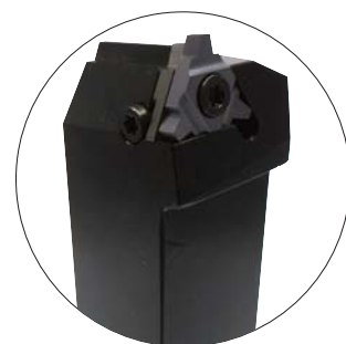
オフセット付タイプ