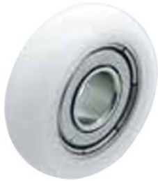
GRL-P-U-SUS (ボルト無しタイプ)