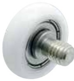
GRL-M-P-U-SUS (ボルト付きタイプ)