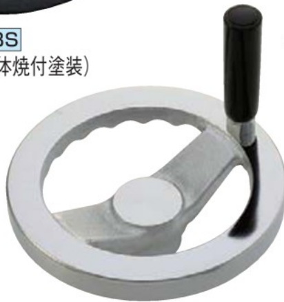
S-ER (回転握り付き、クロムメッキ仕上)