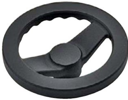
NBS (握りなし、粉体焼付塗装)