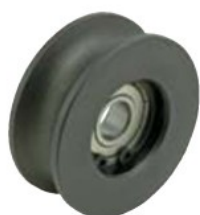
GRL-SH-R (スチール製、焼入れ品)