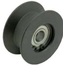
GRL-SH-V (スチール製、焼入れ品)