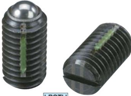
LBSTH (重荷重用 識別:2本ライン)