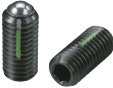
LBSTH-A (重荷重用 識別:2本ライン)