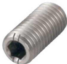
BSUH-A (重荷重用 識別:2本ライン)