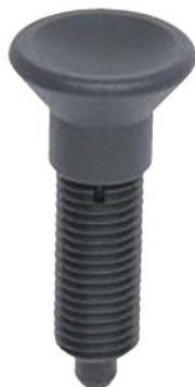
SDXN (スチール製、ナット無し)