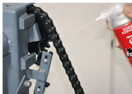
飛び散りを嫌うオープンチェーンのグリースアップ