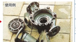
新品に交換することなく再生することでコストダウンができます。