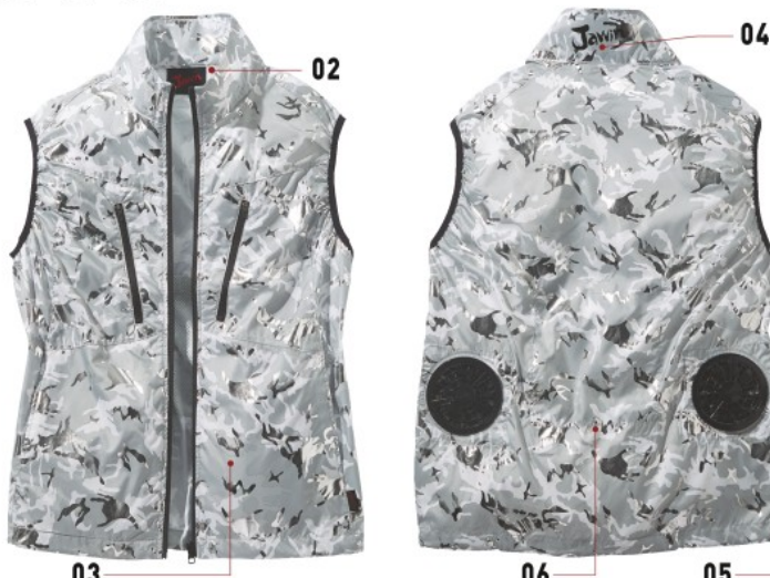
03 シャイニーシルバーカモフラ (C/162) 06 05