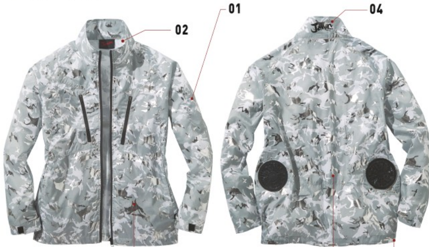
03 シャイニーシルバーカモフラ (C/162) 06 05