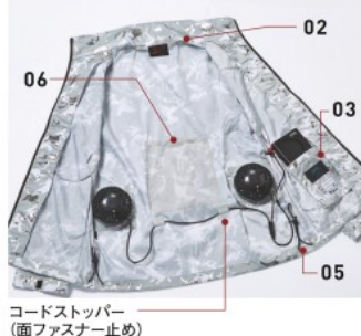
コードストッパー (面ファスナー止め)