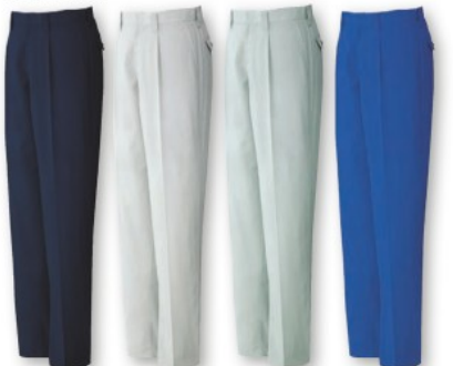
ネイビー (C/011) シルバー (C/036) アースグリーン (C/039) ロイヤルブルー (C/080)