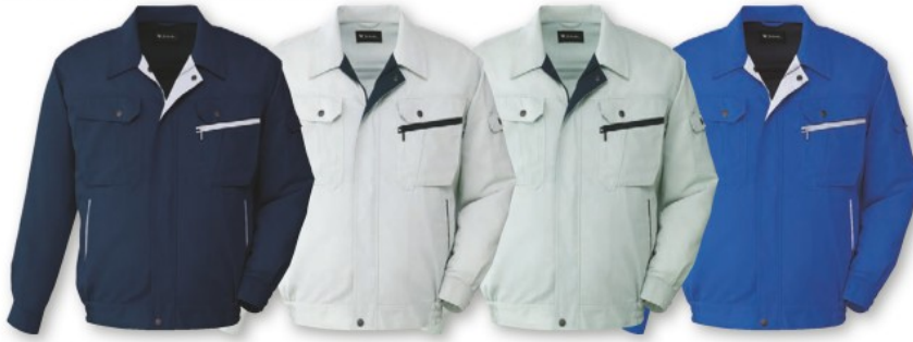
ネイビー (C/011) シルバー (C/036) アースグリーン (C/039) ロイヤルブルー (C/080)