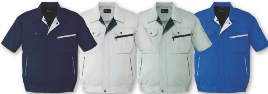
ネイビー (C/011) シルバー (C/036) アースグリーン (C/039) ロイヤルブルー (C/080)