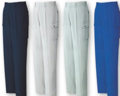
ネイビー (C/011) シルバー (C/036) アースグリーン (C/039) ロイヤルブルー (C/080)