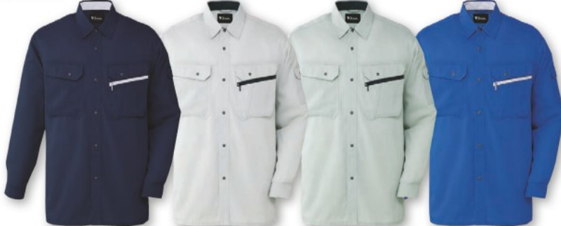
ネイビー (C/011) シルバー (C/036) アースグリーン (C/039) ロイヤルブルー (C/080)