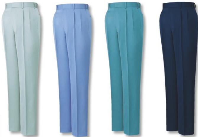
スプレーグリーン (C/104)