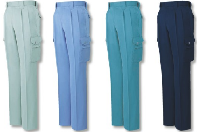
スプレーグリーン (C/104)