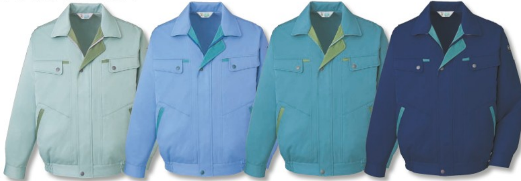
スプレーグリーン (C/104)