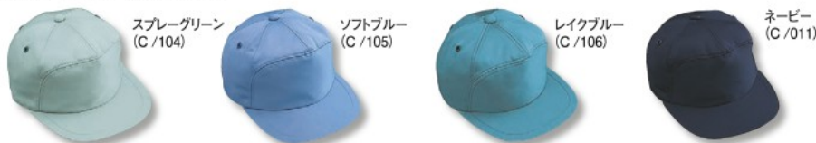
スプレーグリーン (C/104)