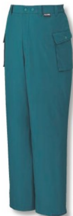
ティールグリーン (C/022)