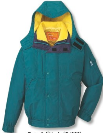
ティールグリーン (C/022)