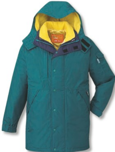
ティールグリーン (C/022)