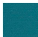
ティールグリーン (C/022)