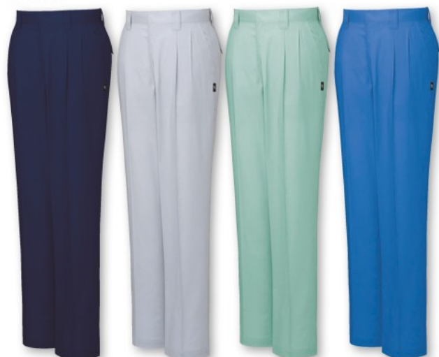
ネイビー (C/011) シルバー (C/036) スモークグリーン (C/062) ロイヤルブルー (C/080)