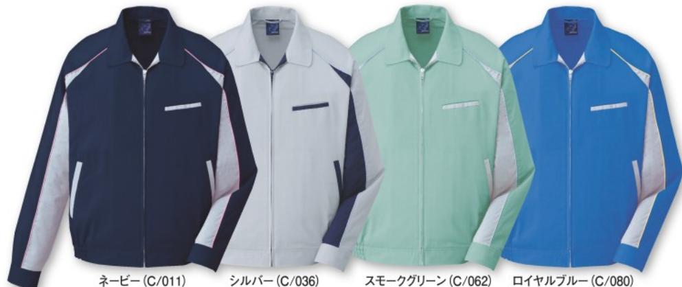
ネイビー (C/011) シルバー (C/036) スモークグリーン (C/062) ロイヤルブルー (C/080)