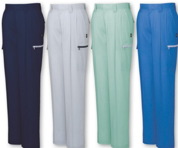
ネイビー (C/011) シルバー (C/036) スモークグリーン (C/062) ロイヤルブルー (C/080)