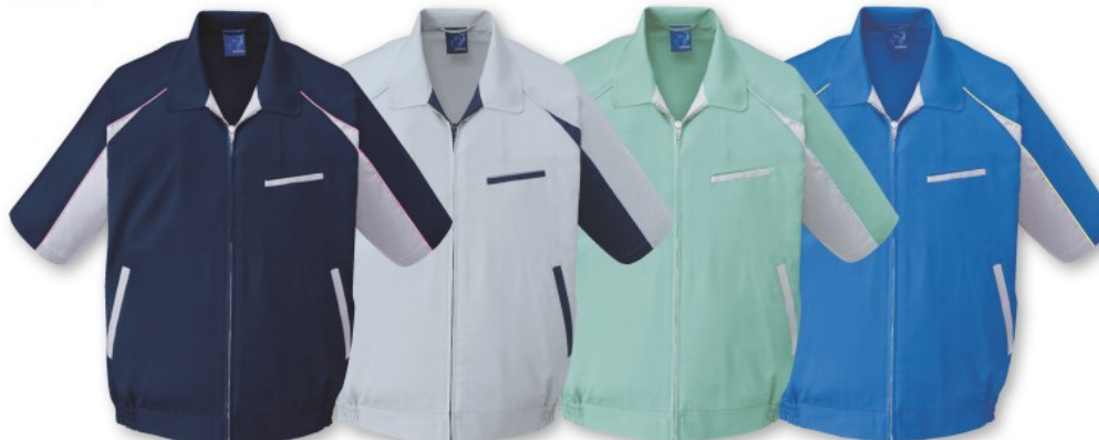
ネイビー (C/011) シルバー (C/036) スモークグリーン (C/062) ロイヤルブルー (C/080)