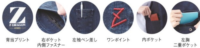
背当プリント 右ポケット内側ファスナー 左袖ベン差し ワンポイント 内ポケット 左胸二重ポケット