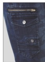
右カーゴポケット