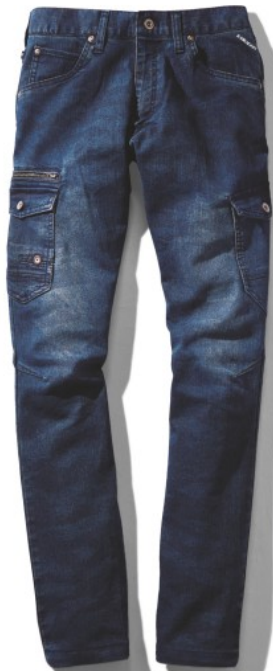
インディゴカモフラ (C/156)