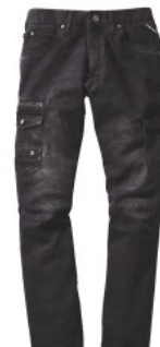
ブラックカモフラ (C/142)