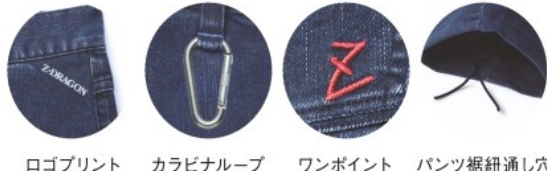
ロゴプリント カラビナループ ワンポイント パンツ裾紐通し穴