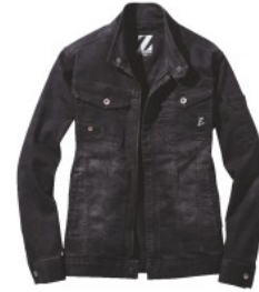
ブラックカモフラ (C/142)