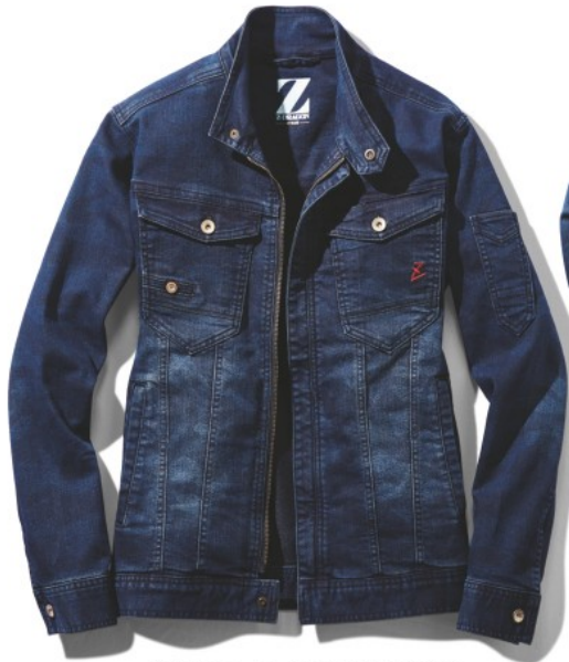
インディゴカモフラ (C/156)