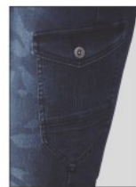
左カーゴポケット