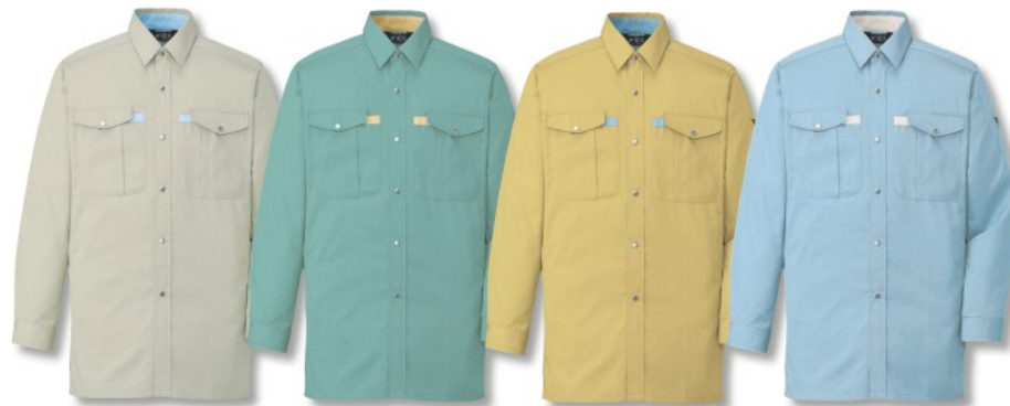
アースグリーン (C/039) グリーン (C/012) マスタード (C/070) ミストブルー (C/082)