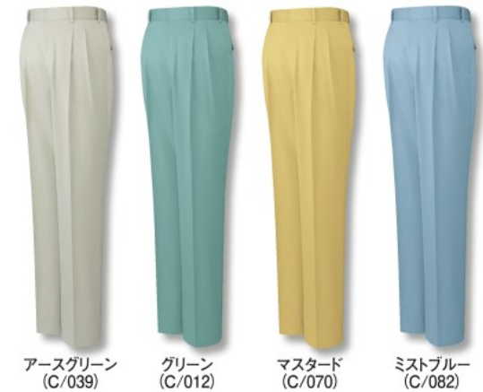
アースグリーン (C/039) グリーン (C/012) マスタード (C/070) ミストブルー (C/082)