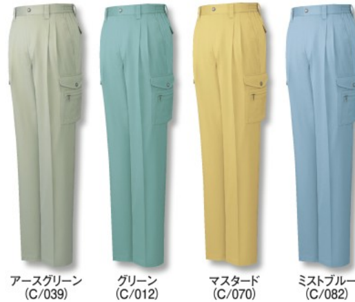
アースグリーン (C/039) グリーン (C/012) マスタード (C/070) ミストブルー (C/082)