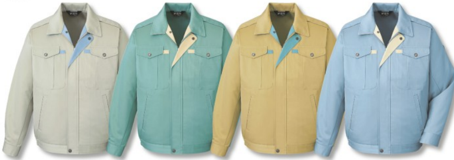
アースグリーン (C/039) グリーン (C/012) マスタード (C/070) ミストブルー (C/082)