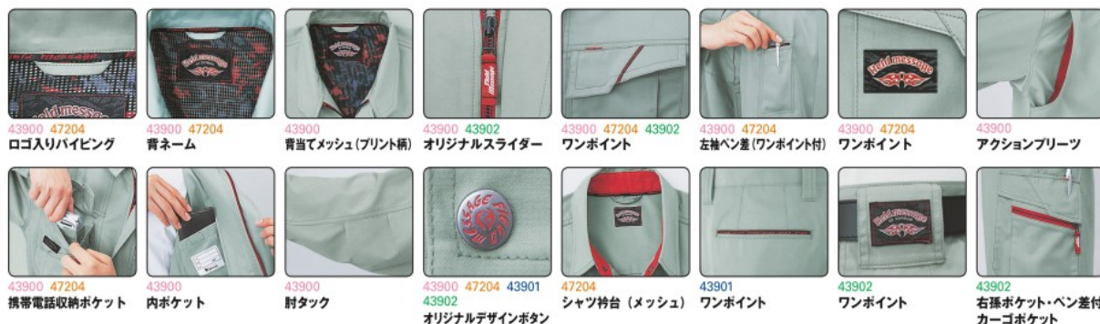
43900 47204 ロゴ入りバイピング