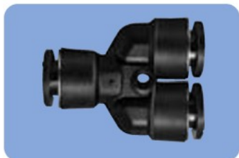
ユニオン Y/UNION Y