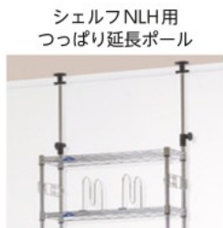
シェルフNLH用 つっぱり延長ポール