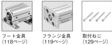
フート金具 (118ページ) フランジ金具 (119ページ) 取付ねじ (129ページ)