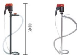
FC-103 (本体:ポリプロピレン製) FC-104 (本体:ステンレス製)

特長 ●1分間に80L移送します。 ●手元のバルブで流量調整がワンタッチで行えます。 用途 ●溶剤用。 仕様 ●電源コード長さ:4.7m ●使用可能粘度:100mPa・S 製造国 ●日本