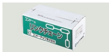
リンクチェーン(ケース入り)